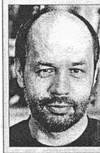
JIŘÍ PEHE, politolog

jmenovat všechny strany, které se zúčastnily voleb. Dcera to dokázala.